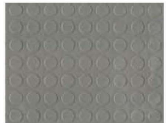
Grigio PVC1073 - h. 2 m PVC1072 - h. 1 m