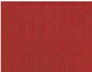
Rosso PVC2412 - h. 2 m PVC2413 - h. 1 m