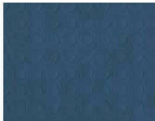
Blu chiaro PVC2404 - h. 2 m PVC2405 - h. 1 m