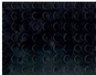
Nero PVC1077 - h. 2 m PVC1076 - h. 1 m