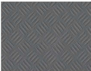
Grigio 4 Righe PVC2418 - h. 2 m PVC2419 - h. 1 m